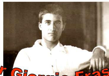
Pier Giorgio Frassati

Un incontro all'insegna della scoperta. Per la prima volta un teatro sapienziale sulla vita di Piergiorgio Frassati. Un'opportunità unica di confrontarsi con un nuovo linguaggio: gli aneddoti meno conosciuti e la fede di un ragazzo che si è lasciato ispirare dall'opportunità di servire.